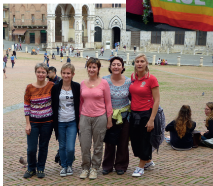
2013 Le staff Gym Club Artannes à Sienne